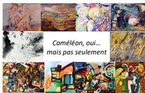
Caméléon, oui... mais pas seulement

Peut-être..., mais pas seulement. Son œuvre, en effet, est particulièrement vaste, et revêt plusieurs aspects, comme le suggère ces quelques tableaux. Mais commençons par l'aspect caméléon.